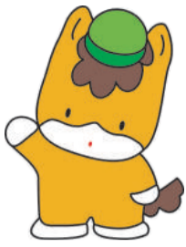
群馬県のマスコット 「ぐんまちゃん」 30-160004